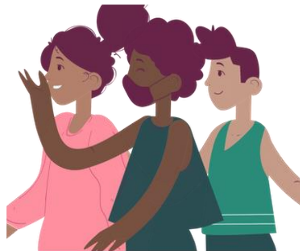
2 группа От 13 до 18 лет включительно

В конкурсе могут принять участие граждане РФ, в возрасте от 6 до 18 лет, занимающиеся (как профессионально, так и в любительских формах) деятельностью в сфере культуры и искусства и обладающие исключительными творческими способностями, в том числе учащиеся музыкальных школ, средних общеобразовательных школ, воспитанники дворцов культуры и спорта, а также отдельные молодые исполнители.