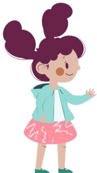
1 группа От 6 до 12 лет